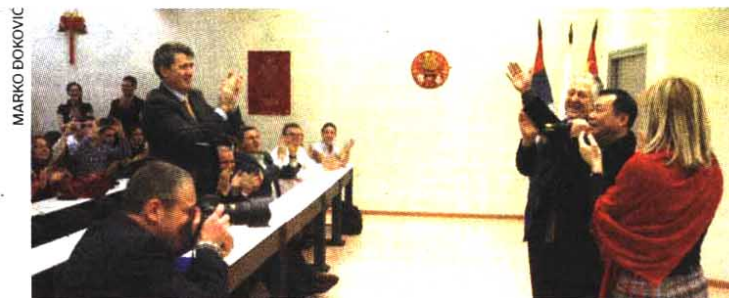
VESELO Savetnik za kulturu u kineskoj ambasadi Sju Hong zapevao

U bogatom kulturno-umetničkom programu nastupili su đaci Osnovne škole „Kralj Petar II Karadorđević“, koji su kroz igru i pesmu prisutnima pokazali svoje znanje stečeno na časovima kineskog jezika. Prisutni su uživali i u nastupu studenata koji su takođe pevali i recitovali na kineskom. Ipak, najveći aplauz pripao je gospodinu Sju Hongu, koji je dirnut sinoćnim programom otpevao pesmu „Tamo daleko“, čime je oduševio, ali i prijatno iznenadio sve prisutne.