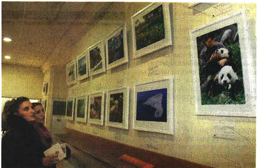
Изложба фотографија „Лепа Кина“ у холу Мегатренд универзитета